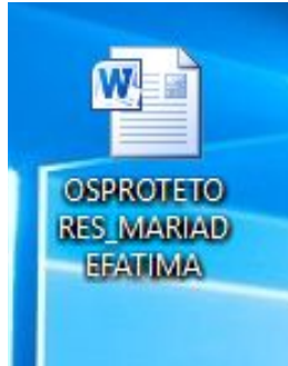
Figura 1 - Renomeação da Fotografia