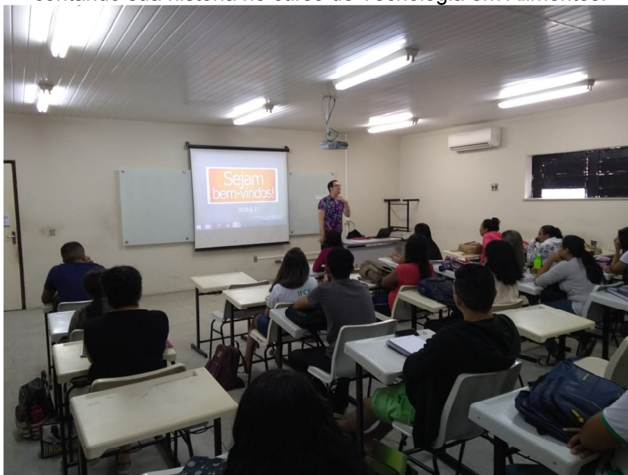
Figura 02 – Calouros do Curso de Tecnologia em Alimentos em bate-papo com nosso Ex-aluno.