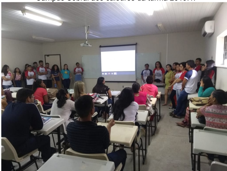
Figura 06 – Interação dos Alunos do 2º semestre de Tecnologia em Alimentos do IFCE Campus Sobral aos calouros da turma 2019.1.