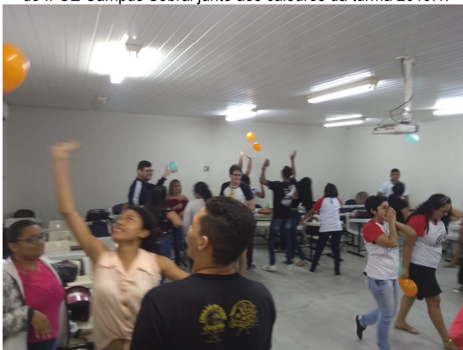
Figura 08 – Interação dos Alunos do 2º semestre de Tecnologia em Alimentos do IFCE Campus Sobral aos calouros da turma 2019.1.