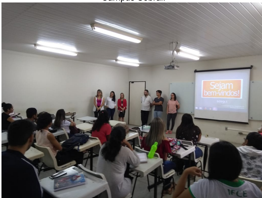
Figura 04 – Apresentação do corpo discente do Eixo da Produção Alimentícia do IFCE Campus Sobral.