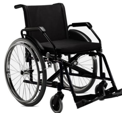
Cadeira de rodas