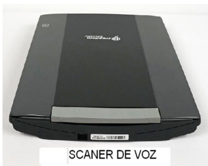
SCANNER DE VOZ