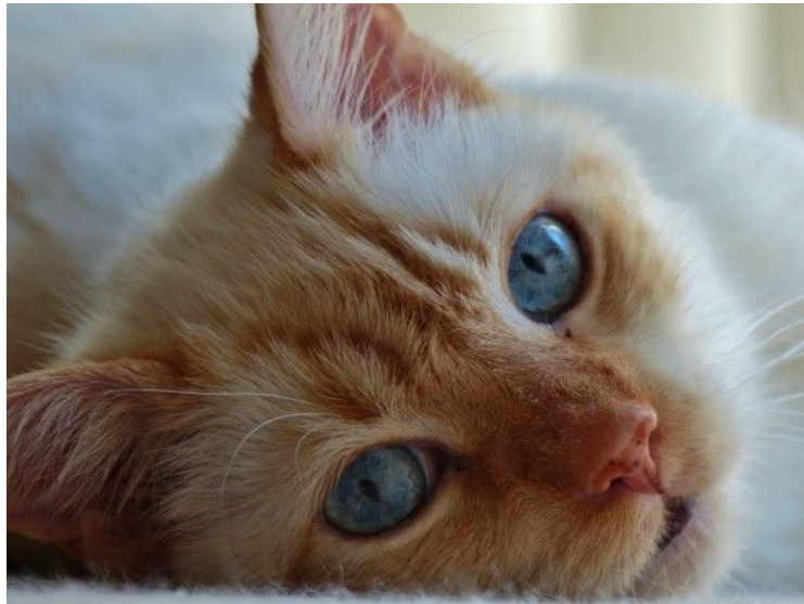
Figura 1. Duis posuere, orci at accumsan suscipit, nibh tortor elementum dui, eget aliquet nulla mi in arcu.

dolor nec neque scelerisque interdum eu ut odio. Mauris placerat orci turpis, at euismod augue tempor vel. Nunc varius vitae risus quis egestas.