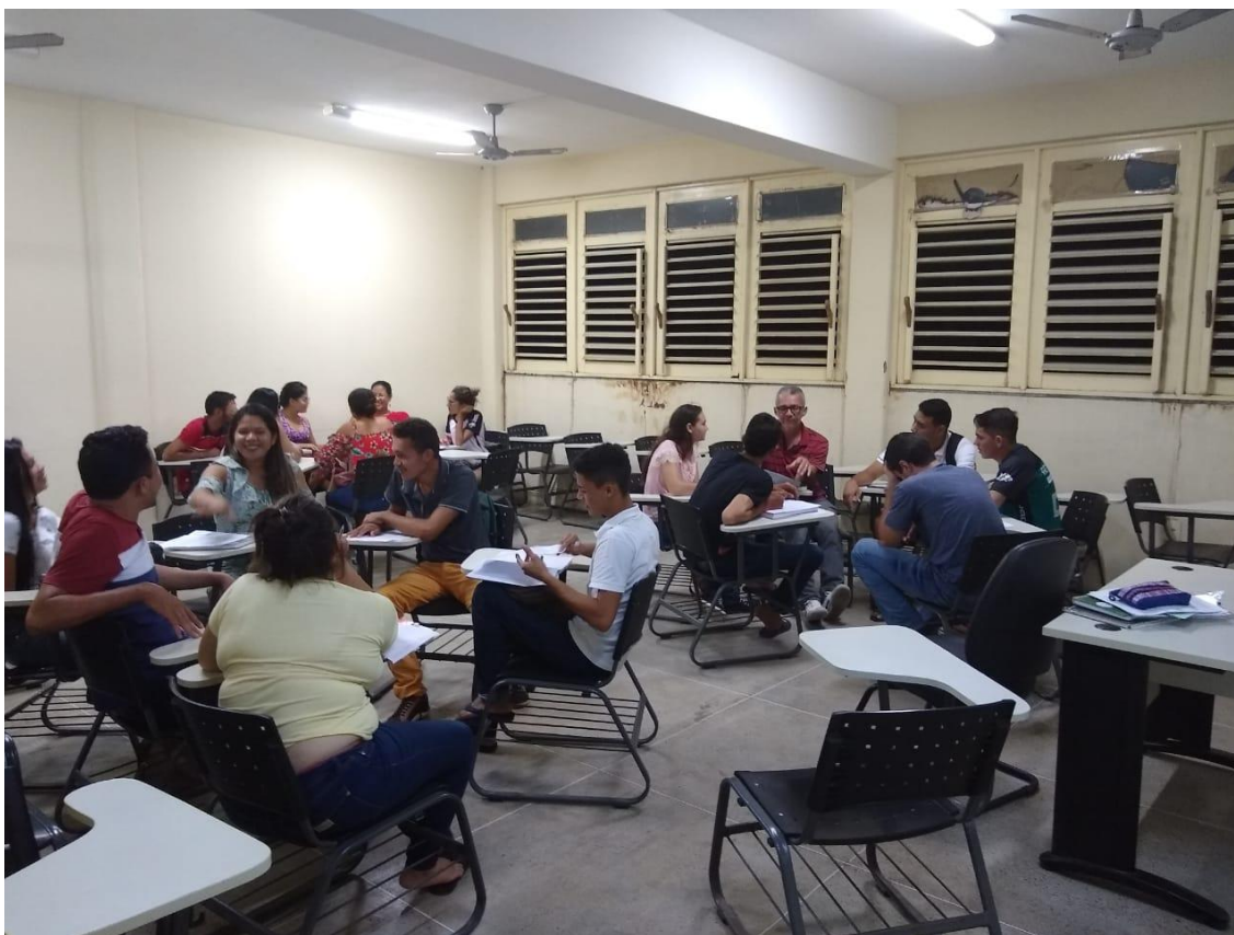
Imagem 1 – Alunos divididos em três grupos para a elaboração da dramatização.