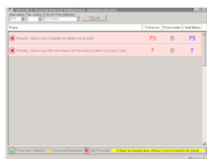
POSSÍVEIS ABANDONOS 2018.2.png 33K