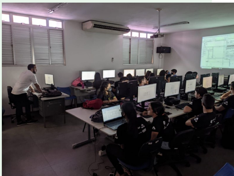
ALUNOS BONTANTE EM PRATICA O USO DO REVIT