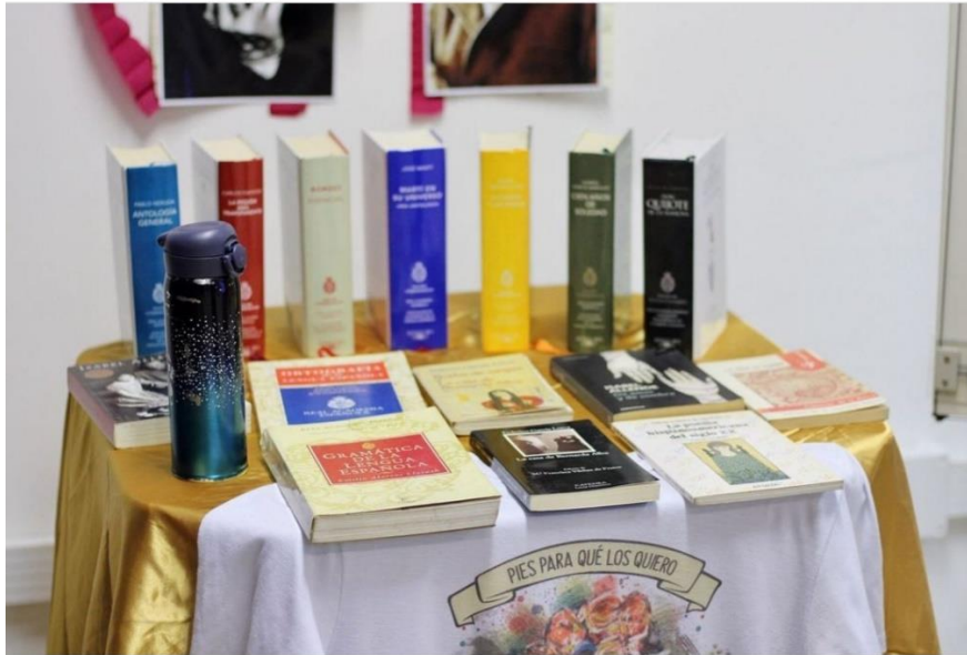
Figura 5: Sala temática de espanhol no IV Fórum de Letras