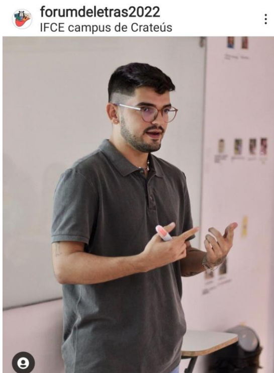
Figura 4: comunicação oral no IV Fórum de Letras