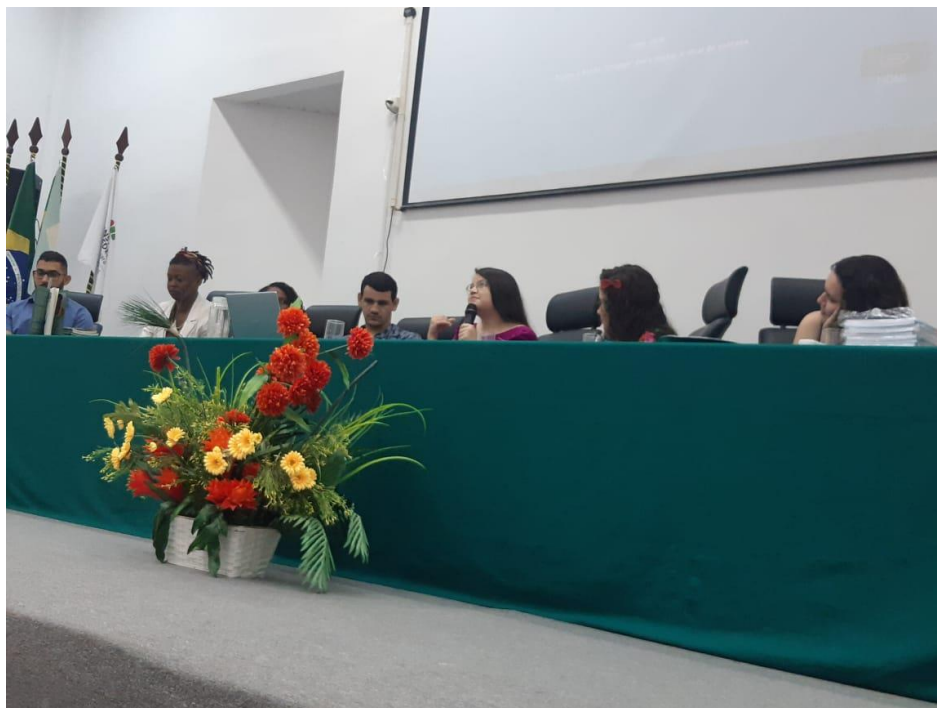
Figura 6: Lançamento de livros no IV Fórum de Letras