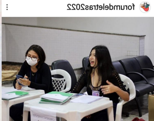
Figura 3: credenciamento dos participantes do IV Fórum