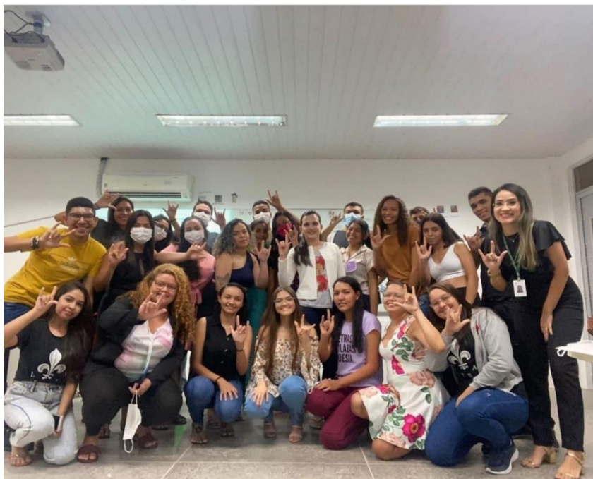
Figura 7: Oficina de Libras no IV Fórum de Letras

Em relação à ação de dar continuidade ao programa “Centro de Línguas” implantado em 2019, houve, um novo processo seletivo com oferta de curso básico de espanhol e inglês ministrados, respectivamente, pelos (as) profs André e Paula Pedrosa, assim como o curso de extensão em inglês conversação, ministrado pela profa Paula Pedrosa. No processo seletivo para os cursos houve mais de 200 (duzentos) candidatos inscritos, o que superou as expectativas da equipe docente do curso de Letras. As aulas iniciaram ainda no mês de setembro.