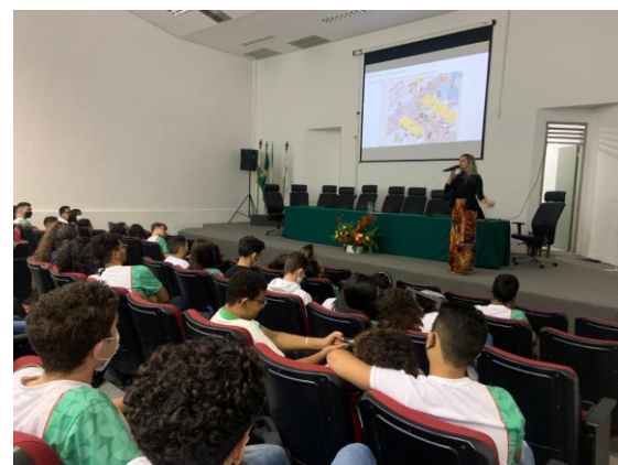
PALESTRA SOBRE IST'S