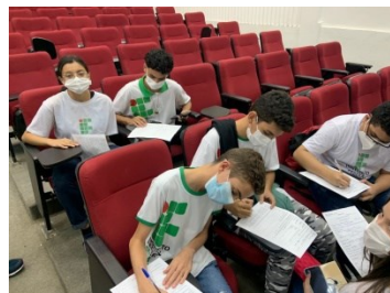
APLICAÇÃO DO QUESTIONÁRIO DE AVALIAÇÃO DA SITUAÇÃO DE SAÚDE