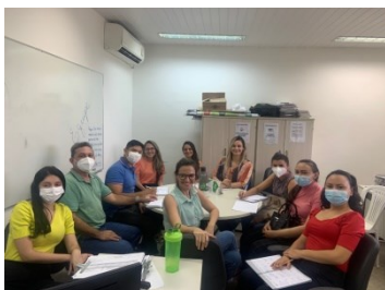
REUNIÃO DA CAE COM OS RESIDENTES