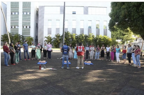
CURSO DE PRIMEIROS SOCORROS PROMOVIDO PELA DAE/REITORIA