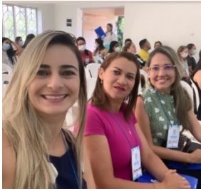
CONFERÊNCIA MUNICIPAL DE SAÚDE MENTAL