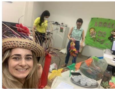
PARTICIPAÇÃO NA ORGANIZAÇÃO DO SÃO JOÃO