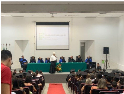
SOLENIIDADE DE COLAÇÃO