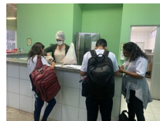
ENTREGA DE POLPAS