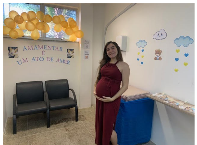
INAUGURAÇÃO DA SALA DE APOIO À AMAMENTAÇÃO