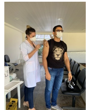
VACINAÇÃO CONTRA INFLUENZA PARA SERVIDORES E TERCEIRIZADOS DO IFCE