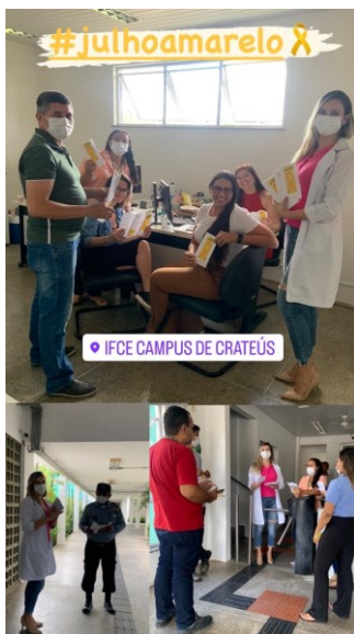
JULHO AMARELO: PREVENÇÃO DAS HEPATITES VIRAIS