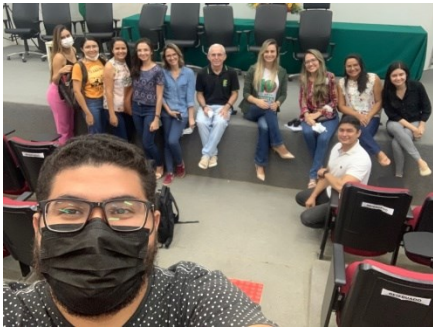
REUNIÃO DE PLANEJAMENTO ENTRE CAE, DIREÇÃO DE ENSINO E RESIDENTES