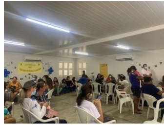
OFICINA DE TERRITORIALIZAÇÃO