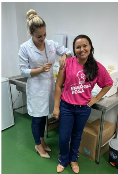
ATUALIZAÇÃO VACINAL DOS SERVIDORES E TERCEIRIZADOS