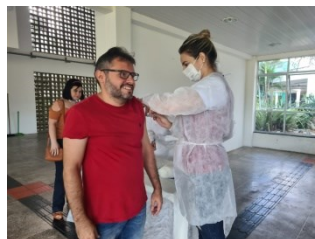
VACINAÇÃO CONTRA INFLUENZA PARA PROFESSORES