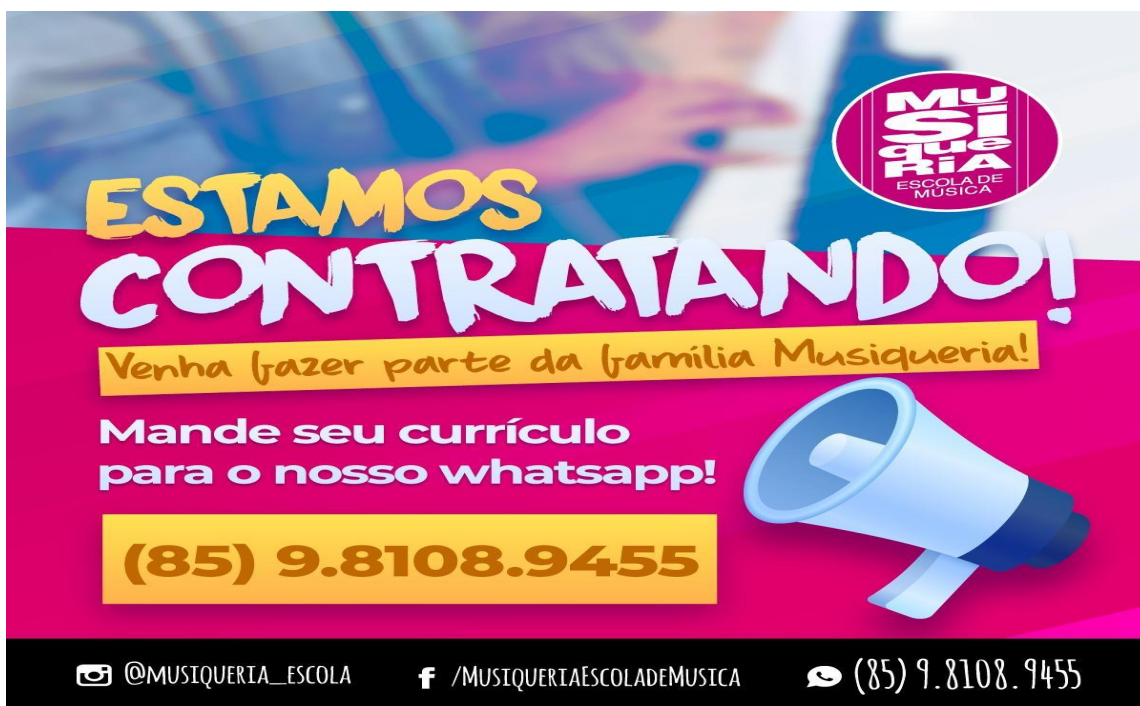
Figura 14: Banner de divulgação da Escola de Música Musiqueria para os estudantes do CTIM.