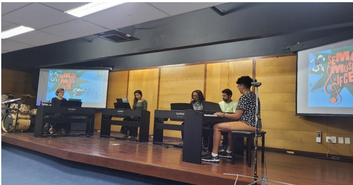
Figura 2: Recital realizado durante a Semana da Música 2023.2

https://ifce.edu.br/fortaleza/noticias/semana-da-musica-debate-musicoterapia