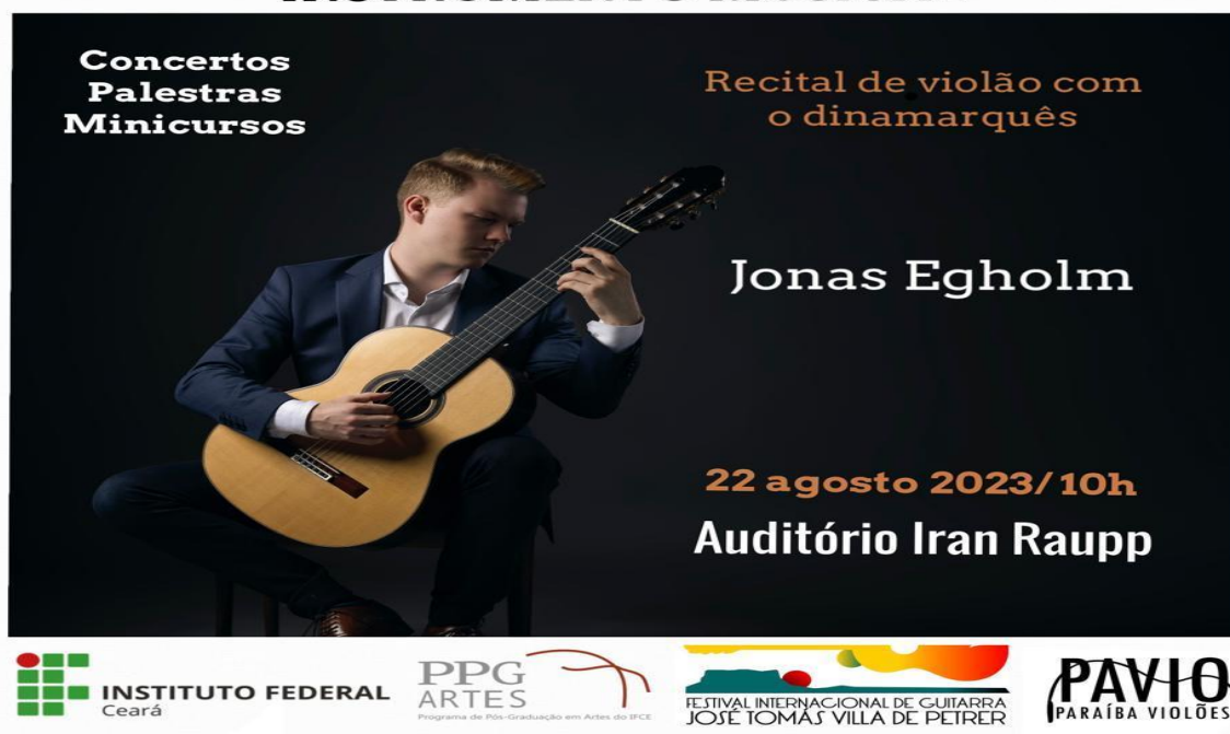
Figura 7: Banner de divulgação do Ciclo Internacional de Seminários em Performance e Ensino de Instrumento Musical