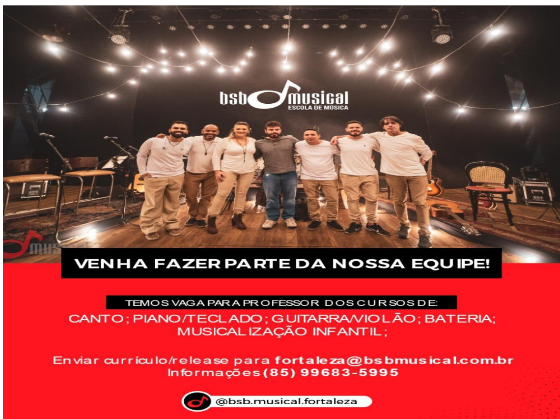
Figura 13: Banner de divulgação da Escola de Música BSB Musical para os estudantes do CTIM.