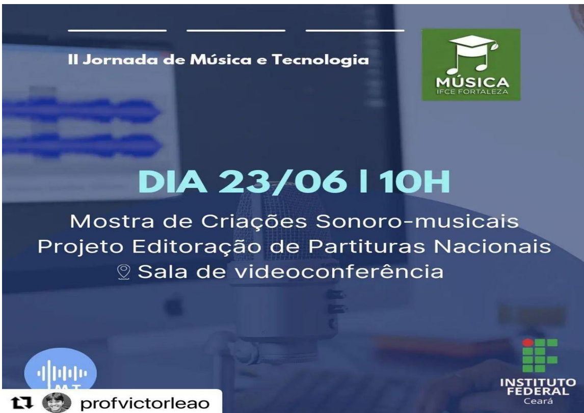
Figura 4: Banner de divulgação da II Jornada de Música e Tecnologia