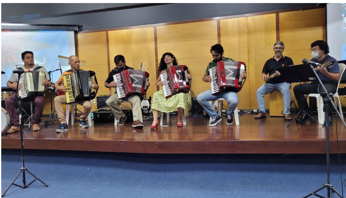
Figura 1: Recital do semestre 2023.1

No semestre 2023.2, os recitais acontecerão durante a programação da Semana da Música 2023.2 entre os dias 12 e 15 de dezembro, passando a contar com quatro dias de apresentações.