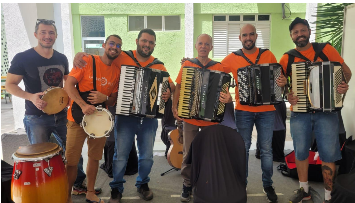
Figura 11: Primeira apresentação do Regional de Sanfonas do IFCE no evento Universo IFCE.