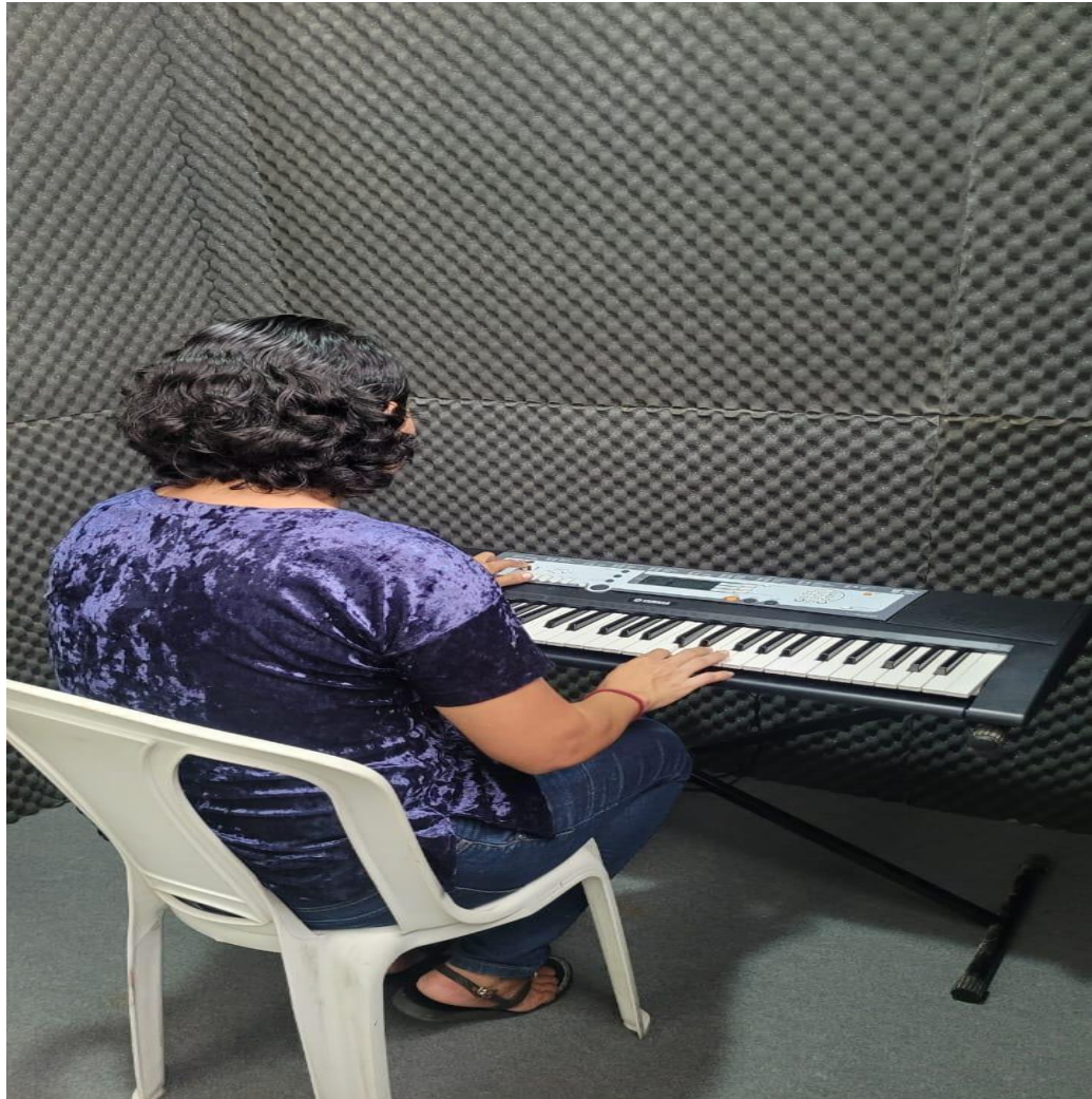
Figura 12: Primeira estudante a utilizar as cabines individuais de estudo do curso.

2023, foi um ganho imensurável para o fortalecimento da aprendizagem instrumental no curso e, conseqüentemente, para permanência no mesmo.