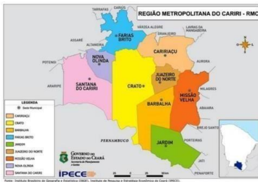
Figura 2 - Mapa da Região Metropolitana do Cariri, em relação geográfica ao Ceará