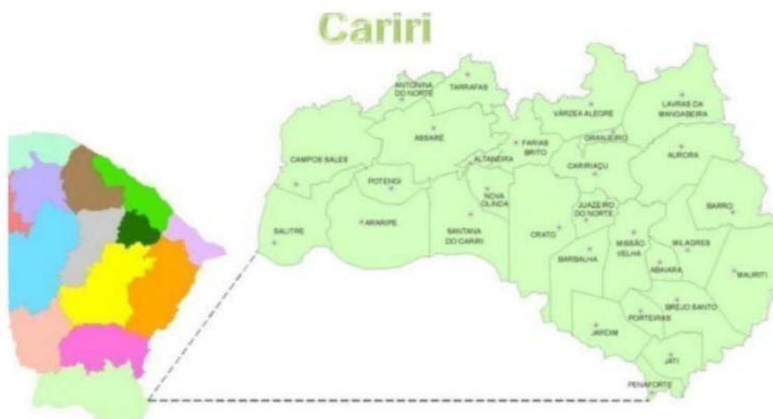
Figura 1 - Mapa da Região do Cariri cearense, localizada ao sul do estado do Ceará