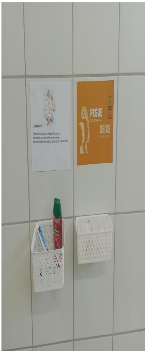
Kit toailete - banheiros femininos discentes

Objetivo: Propiciar acesso a absorventes e kit de higiene coletivo, sobretudo para quem mais necessita e/ou tem acesso reduzido